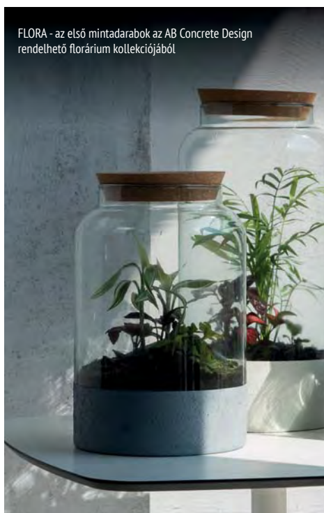
FLORA - az első mintadarabok az AB Concrete Design rendelhető florárium kollekciónak