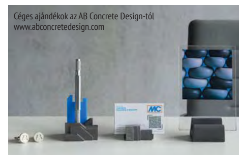
Céges ajándékok az AB Concrete Design-tól www.abconcretedesign.com

A növényesítés és a természettudatos építkezés számtalan gazdasági, ergonómikus és egészségügyi előnyt nyújthat. Az irodaházak növényesítése vonzóbbá teszi a munkakörnyezetet és javíthat az emberek közérzetén és produktivitásán is.